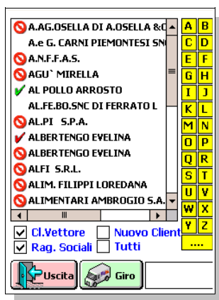
Videata Elenco Clienti