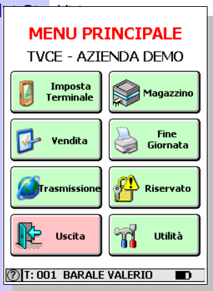
Videata Menu Principale