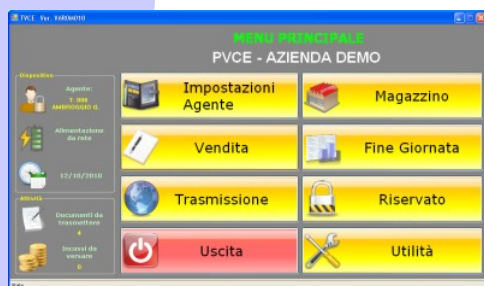
Videata Menu Principale