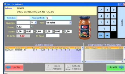
Videata Dettaglio Riga Prodotto

In questo modo la garanzia per il cliente è totale.