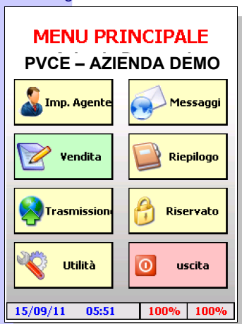
Videata Menu Principale

Inserimento Ordini Clienti in diverse modalità: - Da elenco articoli - Da assortimento cliente - Da copia commissione (ordinato abituale) - Per famiglia e sottofamiglia di prodotto - Da scansione barcode Stampa conferma d'ordine Consultazione Estratto Conto Registrazione Incassi per eventuale acconto Registrazione Incassi su sospesi (Estratto Conto / Partite Aperte) Consultazione elenco incassi Stampe di utilità varie Stampe del riepilogo statistico di fine giornata Collegamento dati con la sede via seriale, rete TCP/IP o GSM/GPRS Ristampa di tutti i documenti emessi Storico degli ordini emessi Storico degli incassi effettuati